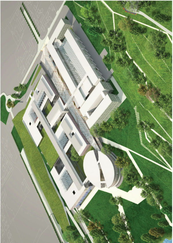
Veduta aerea del complesso da sud est.