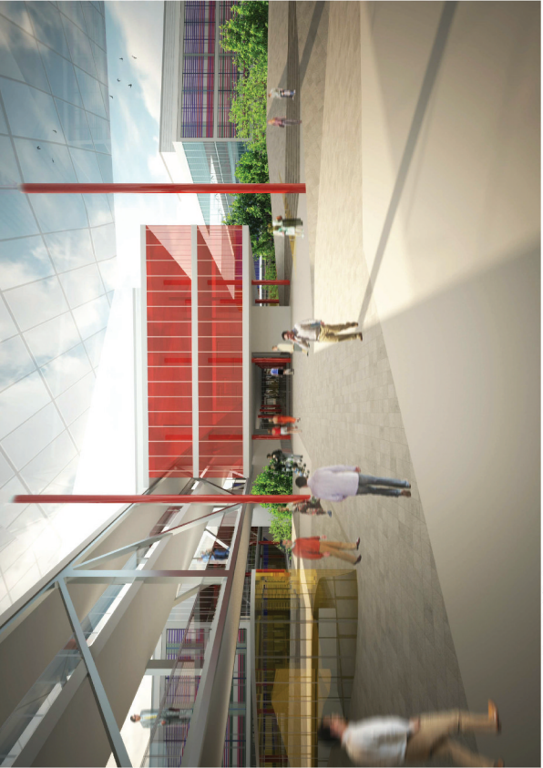
Veduta dell'ingresso dell'ospedale dalla piazza.