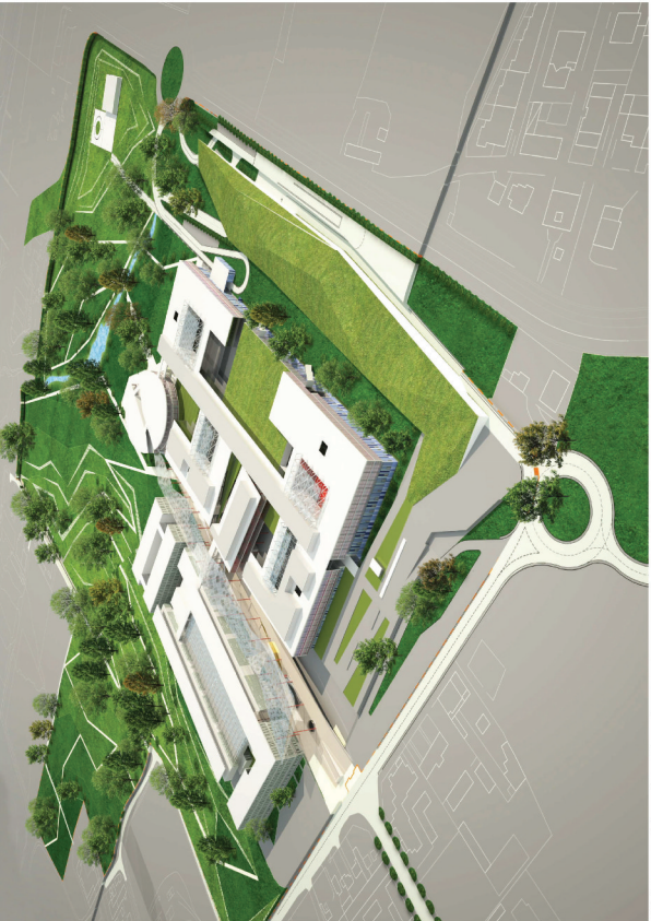
Veduta aerea del complesso da nord ovest.